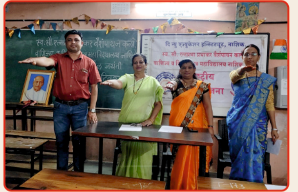
सरदार वल्लभभाई पटेल जयंतीनिमित्त प्रतिज्ञा