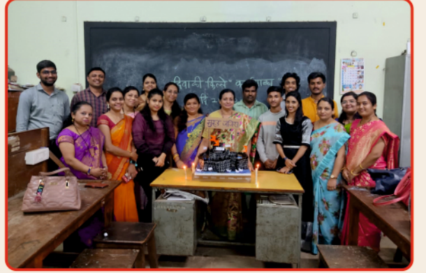
दिवाळी किल्ला तयार करण्याची कार्यशाळा