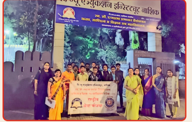
राष्ट्रीय सेवा योजना स्वच्छता मोहिम रॅली