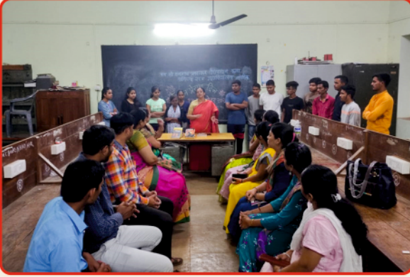
डॉ.ए.पी.जे. अब्दुल कलाम यांच्या स्मृती प्रित्यार्थ वाचन प्रेरणा दिन