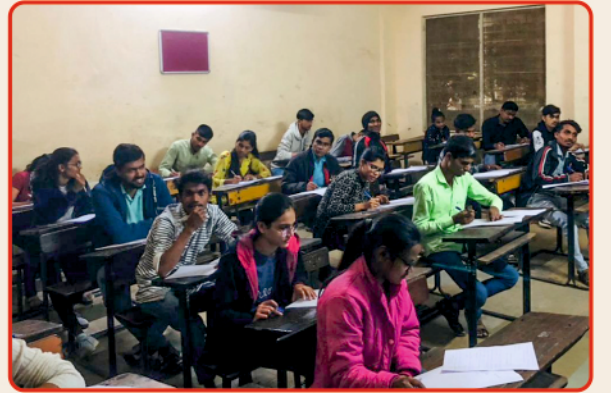
निबंध स्पर्धेत सहभागी विद्यार्थी